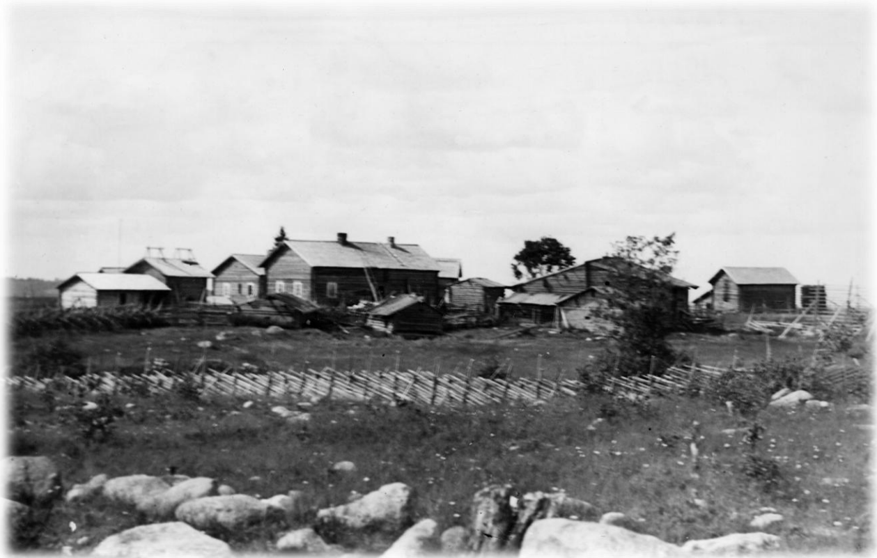
Kansikuva: Miikkulanvaaran kylä vuonna 1907 14 .